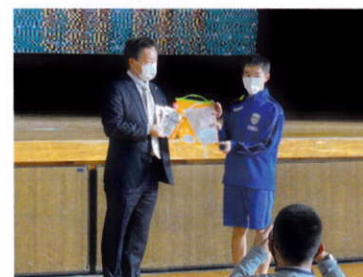
11月11日、例会終了後 篠原中学校支援品贈呈式